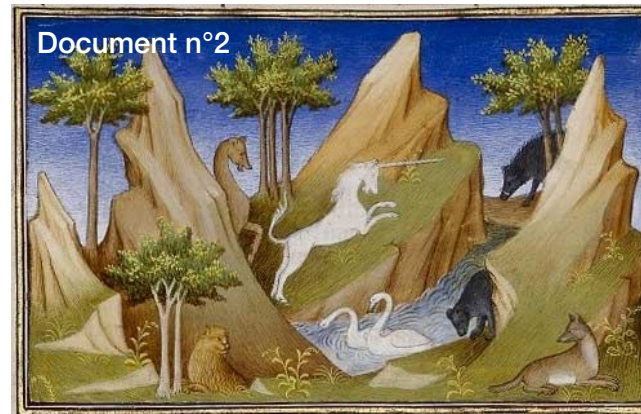
Source : illustration dans le livre de Marco Polo, Le livre des merveilles , réalisé vers 1298.

Source : DRÈGE, Jean-Pierre, Marco Polo et la route de la soie, Gallimard, collection découverte, 1989, p.86